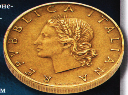
Рисунок на монете номиналом 20 лир достаточно прост: на аверсе нежный женский профиль, символизирующий Италию, в обрамлении колосьев, а на реверсе — ветвь дуба, эмблема добродетели, силы, смелости, достоинства и мощи государства. Ветвь дуба считается символом Итальянской Республики.

Итальянского королевства и монеты номиналом 20 и 200 лир Итальянской Республики. В 1968 году к сплаву была добавлена небольшая доля никеля, чтобы монеты были более яркими и менее подверженными окислению.