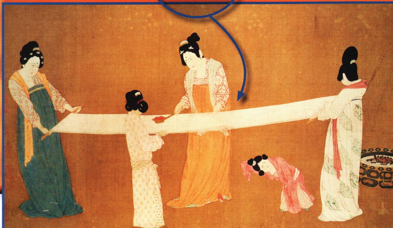
Рисунок XI — XII веков, который относят к периоду императора Хуи-Сун (династия Сун): группа дам тклет шелк.

Первое «денежное» использование бумаги было связано с банковскими