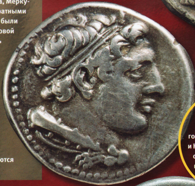
Римская дидрахма с изображением головы Геракла на аверсе и Капитолийской волчицы с близнецами Ромулом и Ремом — на реверсе.