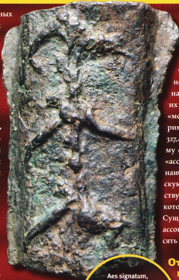
Aes signatum, слиток бронзы со стилизованным изображением рыбьего скелета, предположительно из региона Эмилия-Романья, VI в. до н. э.

Как было сказано, первые слитки бронзы очень сильно отличались друг от друга и не имели никаких символов, которые гарантировали бы точность веса. В начале VI в. до н. э. эти грубые необработанные куски металла уступили место брускам правильной округлой формы.