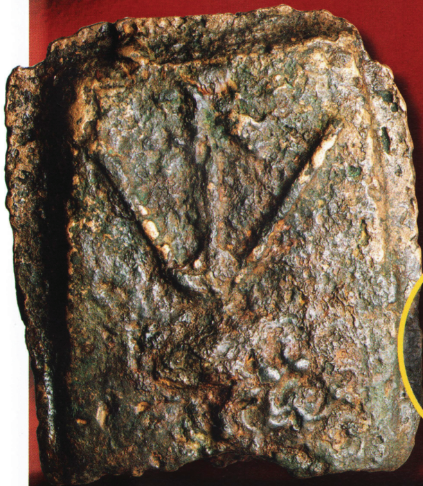
Aes signatum с оттиском засохшей ветви.

Значительным нововведением стали «монеты», называвшиеся aes signatum — слитки бронзы с изображениями или меченая бронза, — отличавшиеся не только правильной формой, но и оттисками, нанесенными на одну или обе их стороны. Единицей веса этих «монет» была либра — древнеримская весовая единица, равная 327,45 г. В применении к бронзовому слитку она получила термин «асс». Позднее так стали называть наиболее распространенную римскую денежную единицу соответствующего веса, полное название которой было «либральный асс». Существовало соотношение: сто ассов равнялись одному быку, а десять ассов — овце.