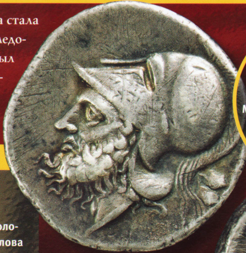
Аверс римской дидрахмы с изображением головы Марса и реверс — с силуэтом лошади.

Рим стремился распространить свои монеты в торговом пространстве Южной Италии, еще находившейся под экономическим и культурным влиянием Великой Греции. Для лучшего восприятия они должны были напоминать монеты, которые в течение долгого времени уже использовались на этой территории. Термин «романо-кампанская монетизация» означает выпуск в обращение монет, отчеканенных от имени Рима греко-кампанскими