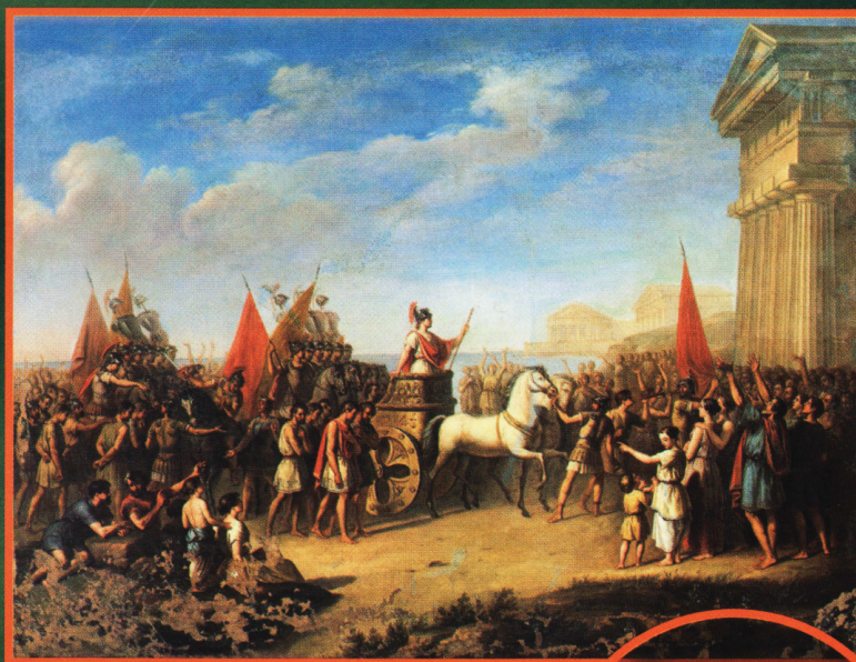
Триумфальный вход Гелона в Сиракузы после битвы при Гимере. Художник Джузеппе Карта, живопись XIX в. Сбоку — аверс декадрахмы, выпущенной в честь победы.

Необыкновенно интересный и привлекательный раздел нумизматики — «осадные монеты», эмиссии которых происходили во время осад городов и крепостей. Этот феномен прежде всего характерен для Нового времени, между XVI и первой половиной XVIII в., когда судьбы войн решались во время бесконечных осад. В периоды жесткого ограничения торговли и нормальных отношений обмена между городом и деревней часто не хватало также и металла для чеканки монет. Необходимость же в деньгах оставалась даже в большей степени, чем в мирное время: солдатам нужно было платить жалованье, а те, у кого еще оставались пищевые продукты или товары первой необходимости, стре-