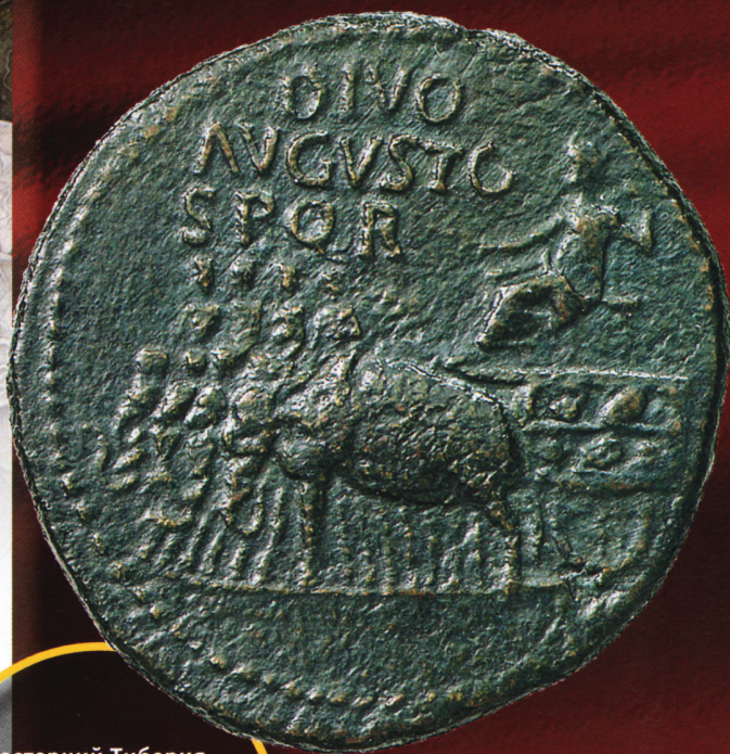
Сестерций Тиберия, посвященный Божественному Августу. Пример посмертной монеты.