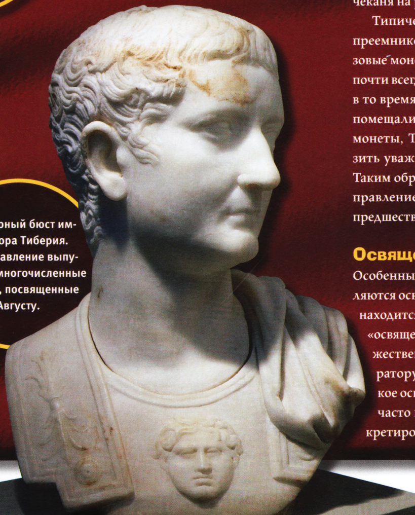
Мраморный бюст императора Тиберия. В его правление выпускались многочисленные монеты, посвященные Августу.

Особенным типом посмертных монет являются освященные монеты. На их реверсе находится латинская надпись Consecratio , «освящение», означающая воздаяние божественных почестей умершему императору, изображенному на аверсе. Такое освящение правителей и их супруг, часто по просьбе преемника, было декретировано Сенатом.