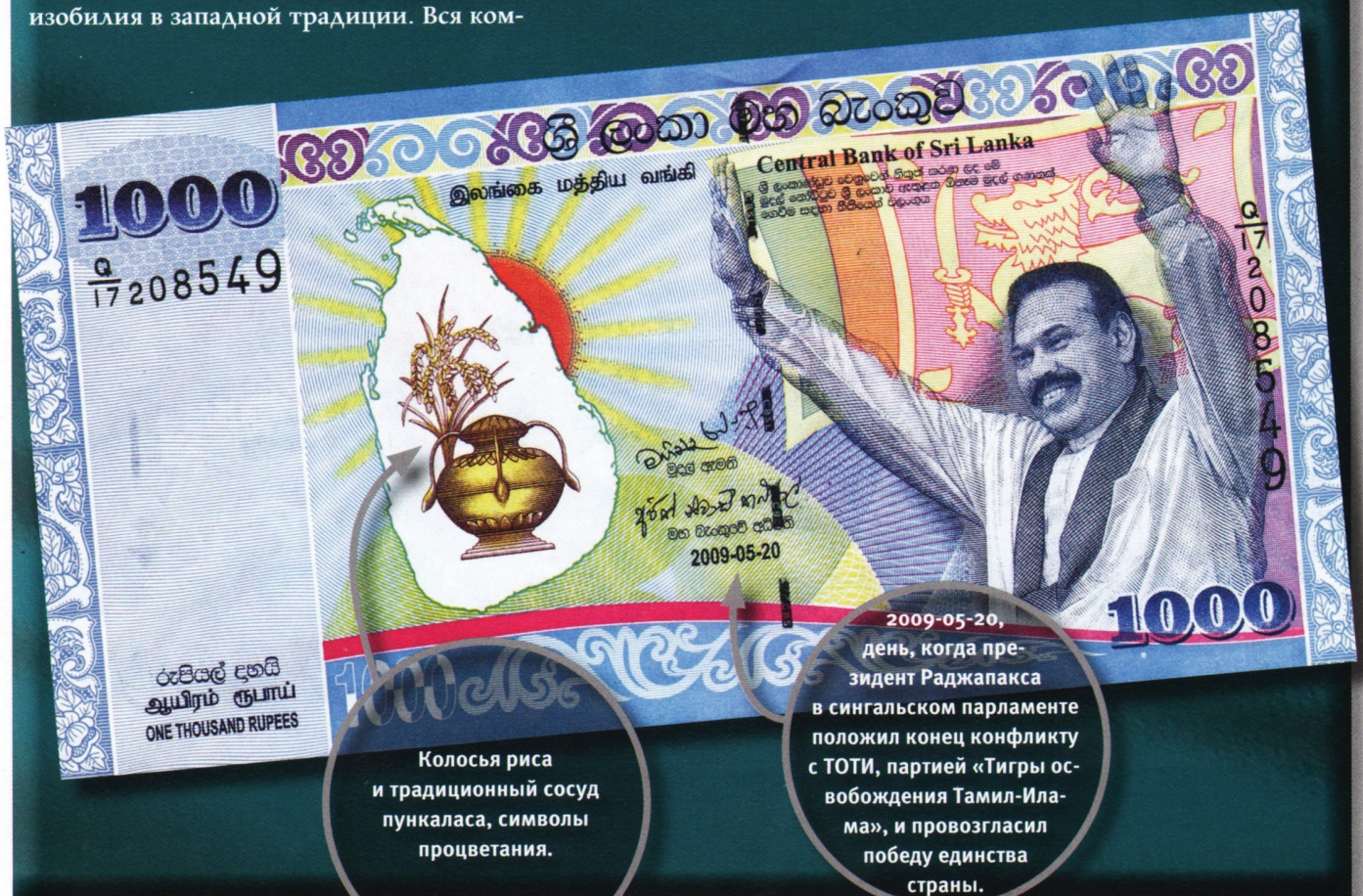
Колосья риса и традиционный сосуд пункаласа, символы процветания.

Справа, под национальным флагом, изображен президент Перси Махендра Раджапакса, находящийся у власти с 2005 г. Номинал банкноты прописью на сингальском, тамильском и английском языках отпечатан внизу слева, а также