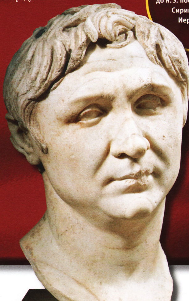
Бюст Гнея Помпея Великого, который в 63 г. до н. э. после завоевания Сирии захватил Иерусалим.

В 63 г. до н. э., после покорения царства Селевкидов в Сирии, римский полководец Гней Помпей, воспользовавшись разногласиями в стане Хасмонеев, без труда завоевал и Иерусалим. Среди правителей местных династий, изображения которых появлялись на монетах, был Ирод Великий, принявший римское подданство в обмен на политическую поддержку. На его бронзовых монетах изображались якорь, трезубец и шлем и были представлены год правления, номинал и надпись на греческом языке: «Царь Ирод» (титул, присвоенный Римским Сенатом). Когда в 4 г. Ирод скончался, Октавиан Август, опасаясь усиления его династии, разделил Иудею на три части и передал их в управление сыновьям царя — Ироду Архелаю, Ироду Филиппу I и Ироду Антипе.