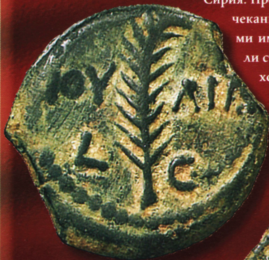
Прута, выпущенная с именем префекта Валерия Грата (15—24). На ней изображен контур пальмовой ветви — вверху, и две лавровых ветви — по бокам.

В ходе многочисленных исследований Туринской плащаницы в 1950-е гг. на правом веке лица было обнаружено нечто, напоминавшее монету. Когда Плащаница была рассмотрена в трехмерной проекции, выяснилось, что это прута Понтия Пилата,