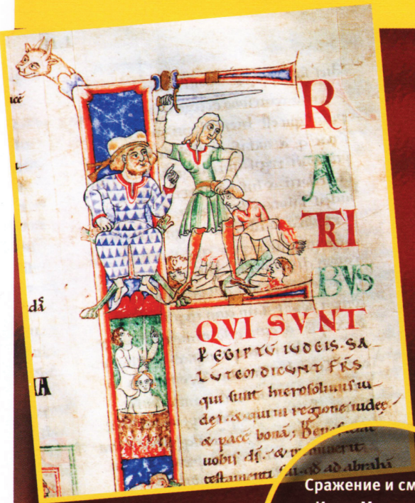
Сражение и смерть Иуды Маккавея, стоявшего во главе евреев в борьбе против Антиоха IV, царя Сирии. Миниатюра из Библии XII в.

Маккавейские бронзовые монеты невысокого номинала были краткими монетами 1 прута. Этот термин в переводе с арамейского языка означает буквально «монета с низким номиналом». На них изображались различные символы, среди которых были якорь, рог изобилия или колесо с лучами, напоминавшее по форме солнце. Из-за повторяющихся имен правителей трудно с точностью установить принадлежность эмиссий. Не до конца ясно, кто их чеканил: Иоанн Гиркан I или его племянник Иоанн Гиркан II. Точно так же монеты Аристобула I могли быть выпущены при Аристобуле II. В Иудее циркулировали и более крупные монеты греческого и птолемеевского происхождения. При Антигоне II Хасмонее (40—37 до н. э.) чеканились бронзовые монеты с изображением рога изобилия и венков из листьев, весившие от 8 до 13 г. Скорее всего, они выпускались, чтобы заслужить поддержку населения во время конфликта с Иродом Великим, который при помощи римлян одержал победу и положил начало династии Иродиадов.