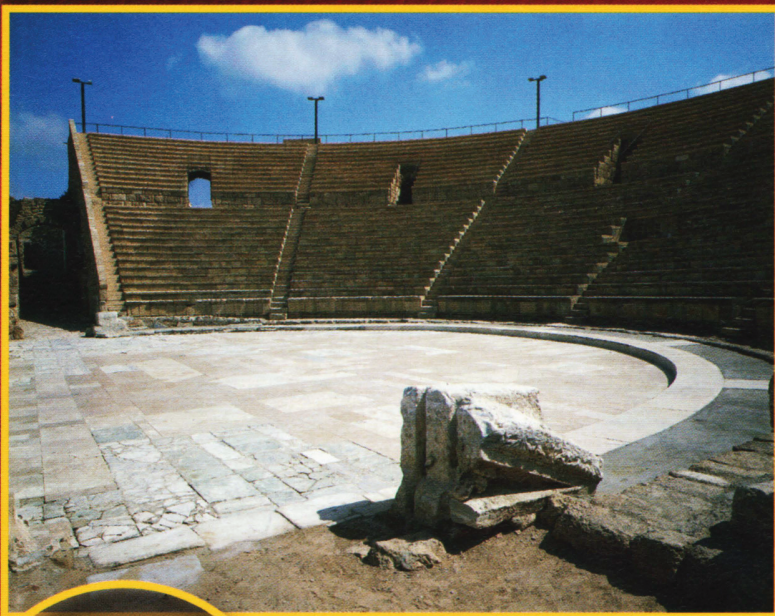
Римский театр, построенный Иродом Великим в городе Цезарее, основанном между 25 и 13 г. до н. э. на территории нынешнего израильского побережья, между Тель-Авивом и Хайфой.

Сыновья Ирода, как и их потомки, продолжали выпускать мелкие монеты, предназначенные для местного обращения, одобренные Римом. Тем не менее, римские императоры никогда полностью не доверяли Иродиадам. Уже в 6 в. Иудея была присоединена в качестве префектуры к римской провинции Сирия. Префектам разрешалось чеканить монету со своими именами: эмиссии были строго связаны с необходимостью местного оборота, серии состояли из мелких бронзовых монет, прут. Известны мо-