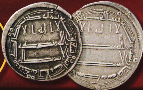
Два серебряных дирхама аббасидских халифов.