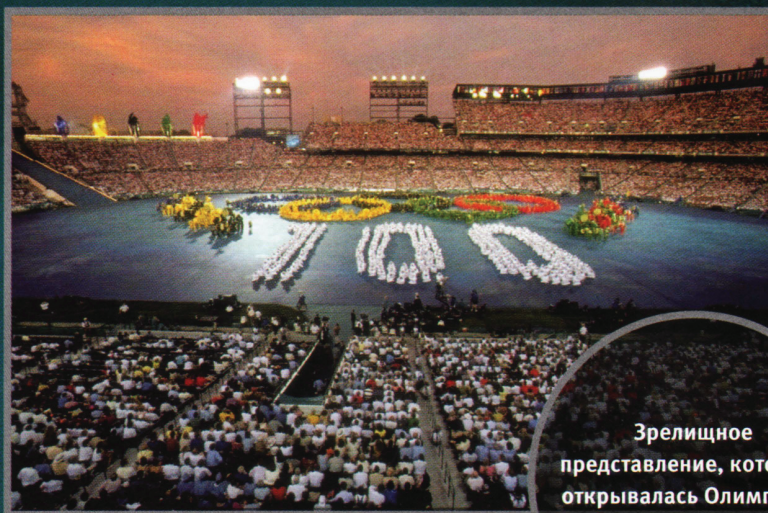
Зрелищное представление, которым открывалась Олимпиада в Атланте в 1996 г.

На реверсе монеты в ознаменование Олимпиады 1996 г. изображены пять олимпийских колец и пылающий факел, расположенные над традиционным символом — хорватскими шахматами.