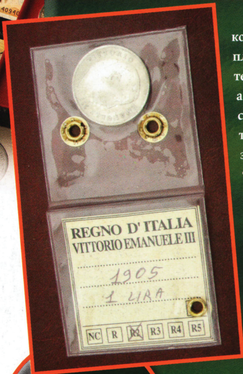
Монета 1 лира 1905 г., запечатанная экспертом в пакет.

Пакеты очень практичны, их легко переносить; если они сделаны из пластика, то это создает дополнительную защиту от легких толчков, а их прозрачность позволяет рассматривать содержимое. Кроме того, они могут быть запечатаны экспертами, что послужит гарантией подлинности содержимого. Но с течением времени возникает опасность того, что материал, из которого был изготовлен пакет, начнет выделять химические реагенты, способные нанести вред металлу. К тому же, если монета запечатана, это исключает возможность подержать ее в руках, лишая владельца одного из его любимых удовольствий.