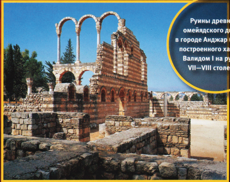
Руины древнего омейядского дворца в городе Анджар (Ливан), построенного халифом Валидом I на рубеже VII—VIII столетий.

Настоящее развитие арабская денежная система получила при омейядском хали-