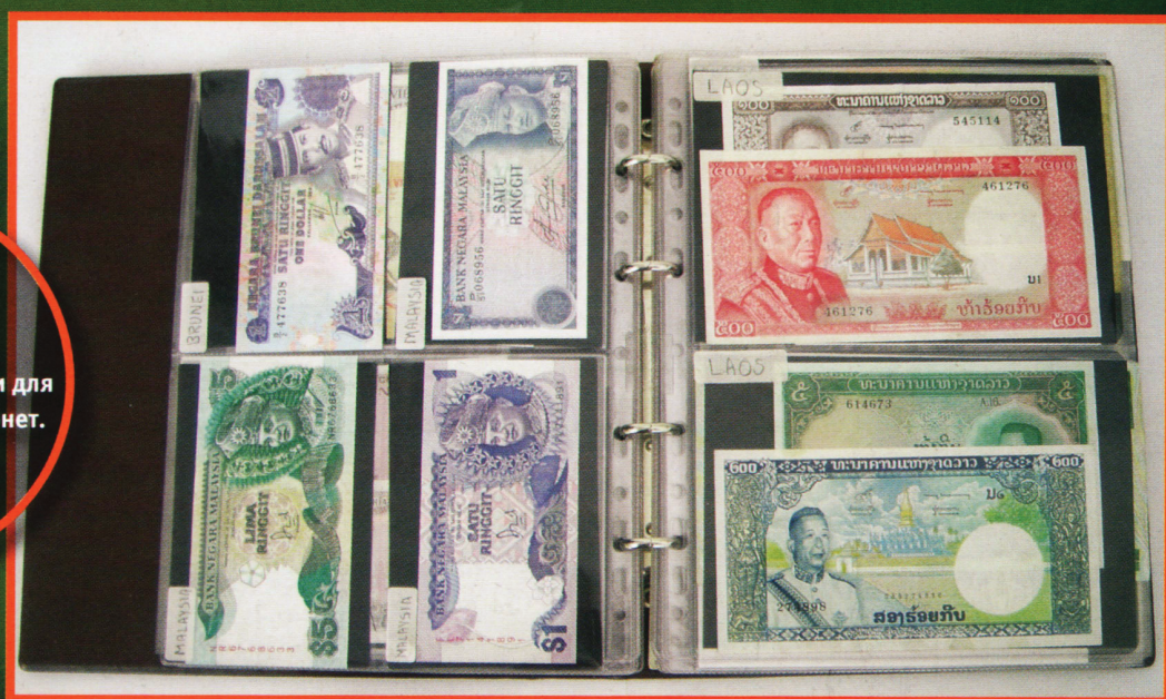
Классификатор с переносными листами для хранения банкнот и монет.

При любом способе хранения коллекцию следует оберегать от сырости.