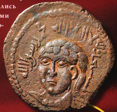
Бронзовый экземпляр царства тюркской династии Артукидов (XI—XII вв.), один из немногих примеров арабских монет с изображениями человеческих фигур.