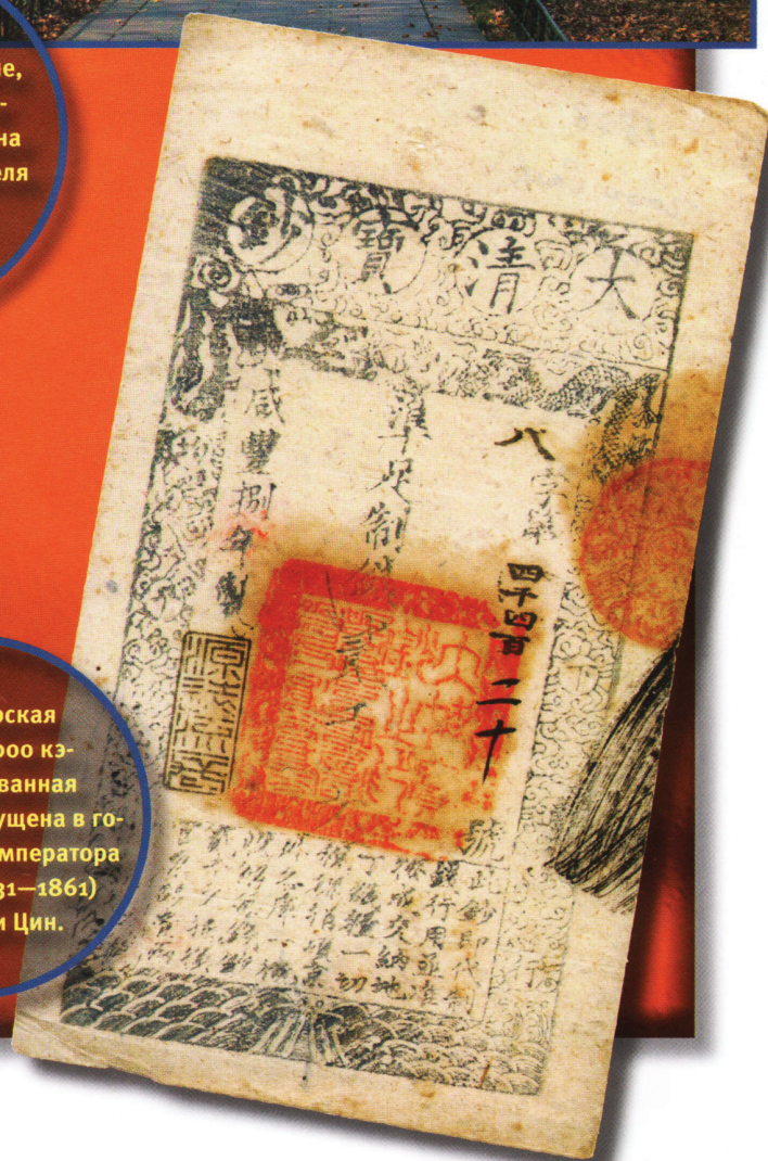
Императорская банкнота 2 000 кэшей, датированная 1858 г. Она выпущена в годы правления императора Сяньфэна (1831—1861) из династии Цин.