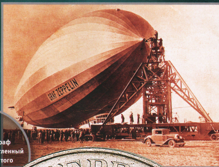
Дирижабль «Граф Цеппелин», запечатленный на фотографии того времени.

На реверсе изображен дирижабль, летящий над земным шаром,