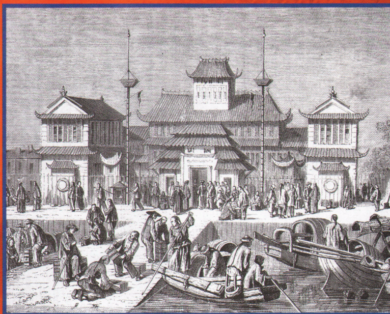
Дворец таможни в Шанхае на гравюре XIX века.

После поражения в первой опиумной войне Китайская империя была вынуждена подписать Нанкинский договор 1842 г., который закреплял победу англичан. Резуль-