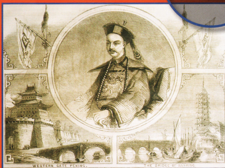
Портрет Сяньфэна — китайского императора периода второй опиумной войны.

Коммерческий банк Индии с английским капиталом был первым иностранным банком, открывшим свои филиалы в Кантоне в 1851 г. и в Шанхае в 1855 г. На протяжении почти 50 лет английские банки