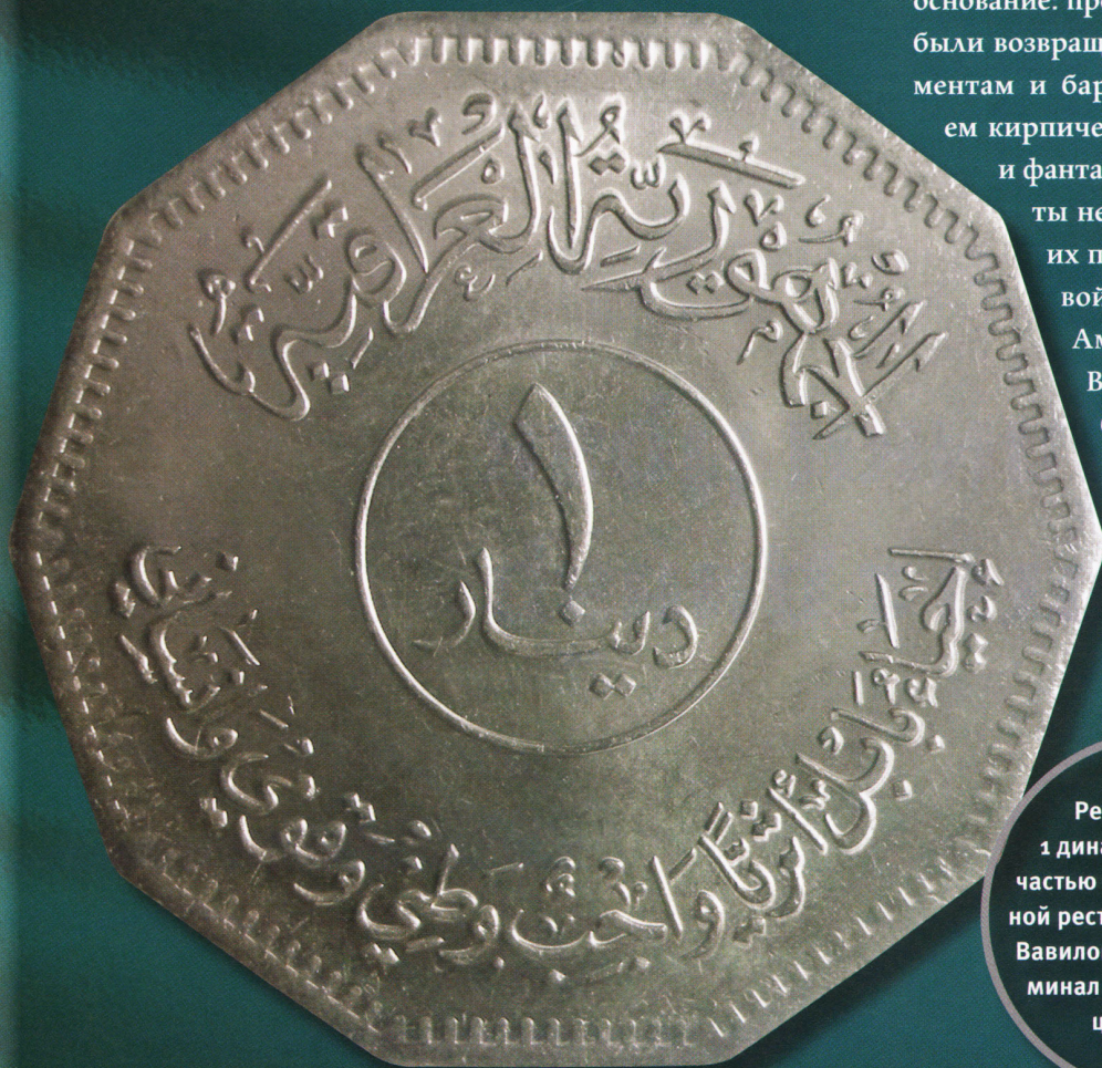
Реверс монеты 1 динар, являющейся частью серии, посвященной реставрации древнего Вавилона. В центре — номинал индо-арабскими цифрами, 1.

пагандой, носила название «Возрождение Вавилона». Раскопки позволили провести новое и более углубленное изучение происхождения и датировки различных сооружений. Работы были разделены на несколько этапов: с одной стороны, начали реконструировать территорию и переносить железнодорожную линию Багдад — Басра и главную дорожную артерию страны N — S (обе прилегли к внутренним городским стенам), с другой — восстанавливали здания Южного дворца, план которых был составлен, а также реставрировали дорожное покрытие дворов. Третий проект, наконец, был направлен на восстановление наиболее ценных памятников Вавилона: храма Мардука и ворот Иштар. У последних, чья реконструкция хранится в музее Пергамон в Берлине, оказалось возможным восстановить лишь каменное основание: прежний блеск и величие были возвращены украшавшим их орнаментам и барельефам с использованием кирпичей с изображениями быков и фантастических животных. Работы не были завершены: в 2003 г. их прервало вторжение в Ирак войск Соединенных Штатов Америки и их союзников. В ожидании, когда можно будет возобновить работы, была запущена программа по мониторингу ущерба, нанесенного археологической зоне, и разработан план ее восстановления.