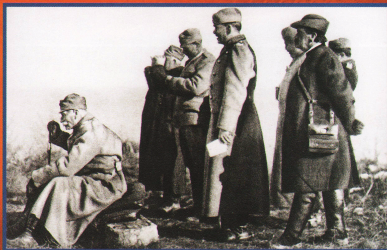
Король Сербии Петр I (сидящий) наблюдает первую немецкую оккупацию Белграда в декабре 1914 г.

Для Сербии были сделаны оттиски на купюрах 10 и 100 динаров, выпущенных Национальным банком королевства Сербии, штемпелями 12 территориальных командований, среди которых были Белград, Крагуевац, Ужице и Вальево. Вначале,