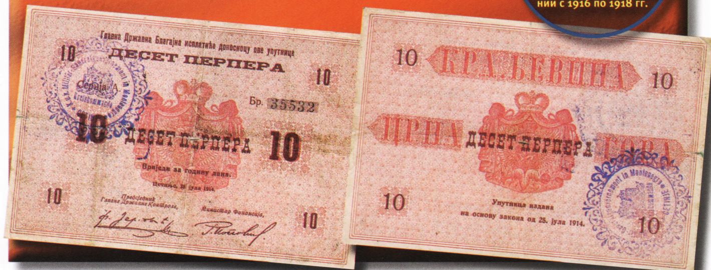
Банкнота 10 перпер, выпускавшаяся в период оккупации в Черногории в 1914 г., со штампом командования в Цетине, находившаяся в обращении с 1916 по 1918 гг.

В Черногории применялся тот же прием, однако использовались более надежные купюры, выпускавшиеся Королевским правительством до 1914 г. В 1916 г. были, таким образом, надпечатаны серии от 5 до 100 перпер: существовало девять типов, на которых стояли оттиски с названиями территорий Цетине, Старый Бар, Подгорица и др. В следующем году появилась еще одна серия оккупационных купюр, с номиналами 1, 2, 5, 10, 20, 50 и 100 перпер, которым австрийское правительство хотело присвоить принудительный курс на балканской территории для того, чтобы получить как можно больше драгоценных металлов.