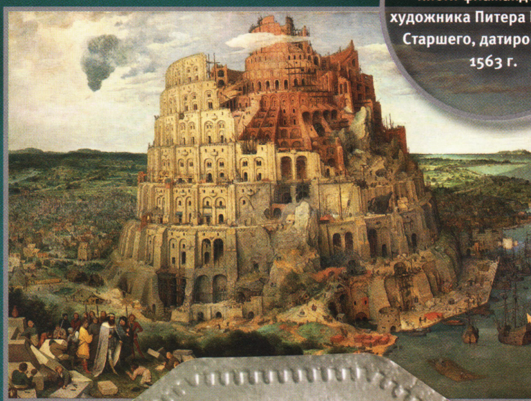
Вавилонская башня на знаменитом полотне кисти фламандского художника Питера Брейгеля Старшего, датированном 1563 г.

На реверсе изображен грандиозный зиккурат Этеменанки, воздвигнутый вавилонским правителем Навуходоносором в честь бога Мардука. В иудео-христианской традиции он носит название легендарной Вавилонской башни. По сторонам от изображения расположена двойная дата эмиссии: слева индо-арабскими цифрами обозначен 1982 г.