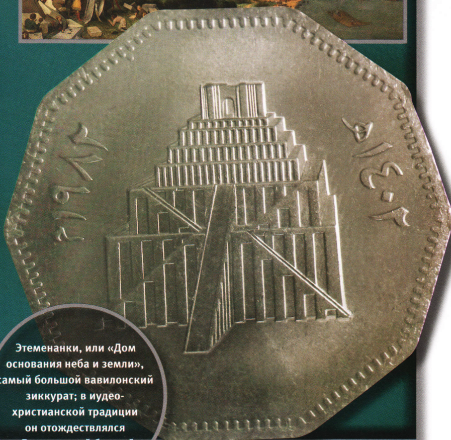
Этеменанки, или «Дом основания неба и земли», самый большой вавилонский зиккурат; в иудео-христианской традиции он отождествлялся с Вавилонской башней.