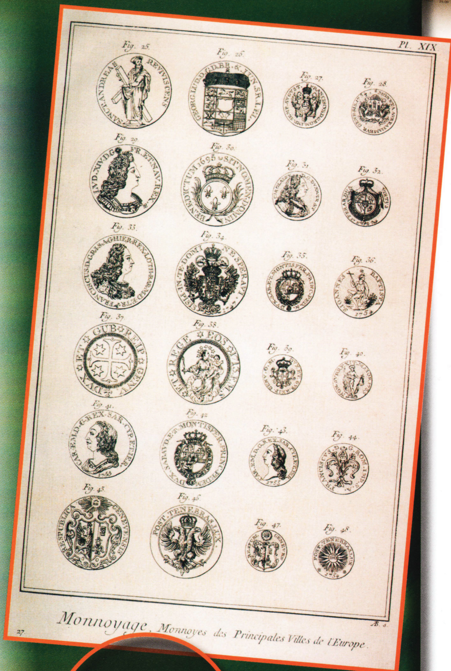
Monnoyage, Monnoyes des Principales Villes de l'Europe.

Другой способ подделки, в прошлом широко распространенный, заключался