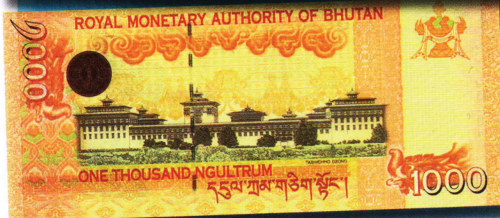
1 тыс. нгултрумов 2006 г. Выпускались также в 2008 г. Лицевая сторона: колесо дхармы (в центре), портрет Джигме Кхесара Намгьяла Вангчука, пятого короля Бутана, он правит с 2006-го (справа). Обратная: монастырь Ташичо-дзонг. Сооружение было построено в XVII в. на севере от Тхимпху. В нем с 1952 г. находится правительство страны.