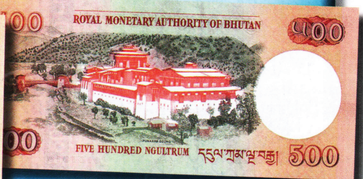
500 нгултрумов 2006 г. Выпускались также в 2011 г. Лицевая сторона: коронационный портрет Угьен Вангчука, первого короля Бутана (правил в 1907—1926). Обратная: монастырь Пунакха-дзонг.

Пятым правитель Бутана Джигме Кхесар Намгьял Вангчук и его жена, королева Джецун Пема, в Токио в ноябре 2011 г. Правящие особы были первыми главами государства, посетившими Японию после землетрясения в марте 2011 г.