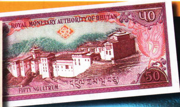
50 нгултрумов 1994 г. Выпускались также в 1985 и 1992 гг. Лицевая сторона: эмблема правительства (слева), колесо дхармы (в центре) и портрет Джигме Дорджи Вангчука, третьего короля Бутана (справа). Обратная: монастырь Тонгса-дзонг. Город Тонгса находится почти в центре страны. В нем жила королевская семья до того момента, как столицей стал Тхимпху.