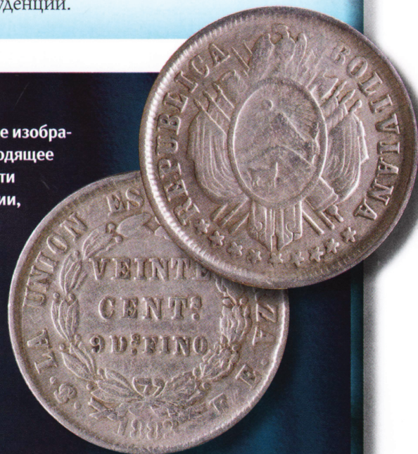
20 сентаво 1883 г. Чеканились из серебра в 1872—1907 гг., кроме 1905 и 1906 гг. Диаметр: 22 мм. Аверс: герб страны, девять звезд и надпись «Боливийская Республика». Реверс: номинал и девиз: «В единстве сила».