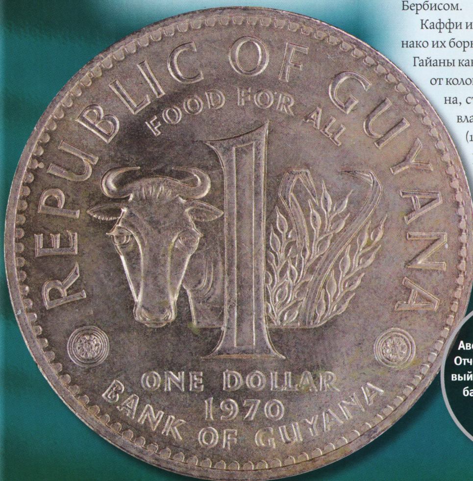
Аверс монеты 1 доллар. Отчеканена в 1970 г. Первый выпуск Центрального банка Гайаны с таким номиналом.

Каффи и его товарищи проиграли, однако их борьба была воспринята народом Гайаны как первый шаг к освобождению от колониального рабства. Когда Гайана, ставшая в XIX в. британским владением, обрела независимость (1966) и провозгласила создание республики (1970), дата 23 февраля была выбрана в качестве национального праздника, а Каффи стал национальным героем.