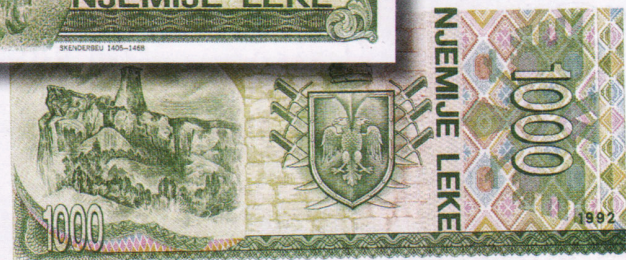
1000 леков 1992 г. Выпускались также в 1995—1996 гг. Лицевая сторона: Георг Кастриоти Скандербег (1405—1468). Он

25 лет отражал атаки Османской империи, возглавлял политическое объединение албанских князей — Лежскую лигу. За заслуги в защите христианской веры папа Каликст III назвал его Христовым воином и защитником веры. Обрат: замок в Круе, неприступная крепость Скандербега, в которой сегодня находится посвященный герою музей.