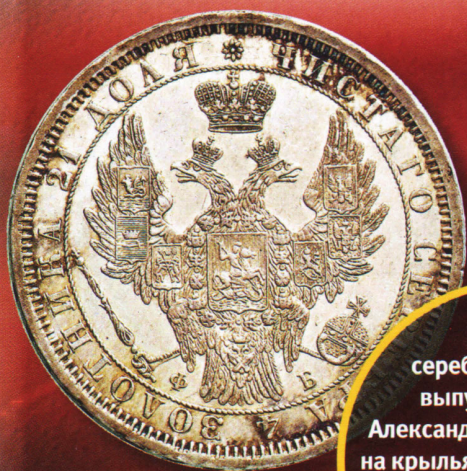
На этом серебряном рубле, выпущенном при Александре II (1855—1881), на крыльях двуглавого орла видны шесть маленьких щитов с гербами стран, присоединенных к империи.

Поскольку после этой реформы монета 5 рублей перестала быть эквивалентом маренго, золотой монеты 20 франков, то им стали 75 рубля, а золотые типологии увеличились.