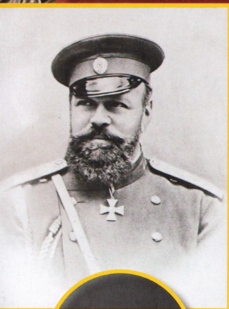
Портрет Александра III в военной форме.