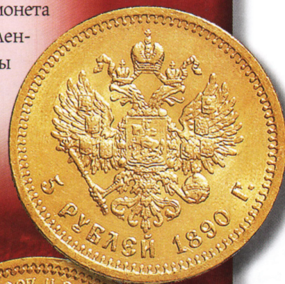
Монета 5 золотых рублей, отчеканенная в 1890 г., при императоре Александре III (1881—1894).