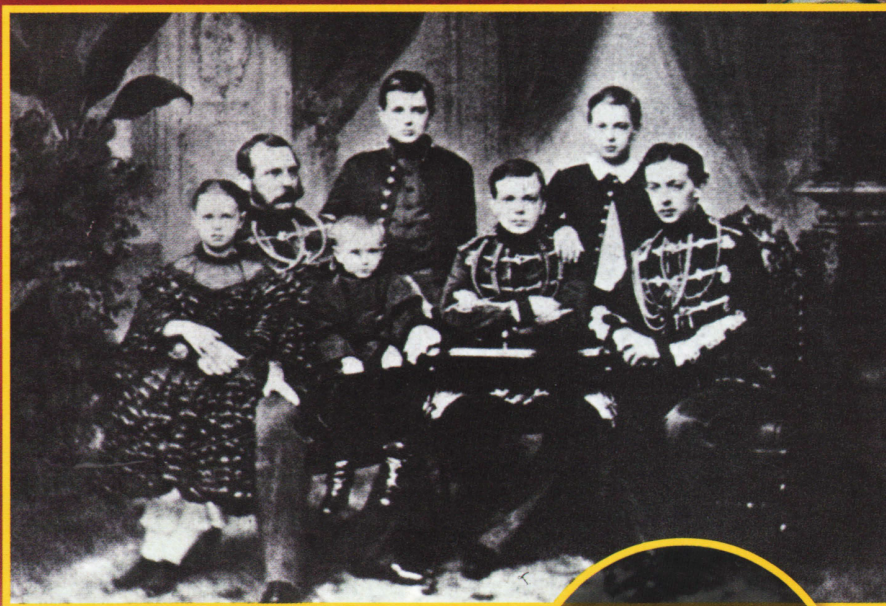
Александр II, правивший в 1855—1881 гг., с детьми.

В декабре 1885 г., при Александре III (1881—1894), после важной реформы русская система пришла к стандарту, принятому с 1866 г. Латинским монетным союзом и широко распространенному в Европе. Золотой рубль, который долгие годы сохранял свой вес (1,2 грамма), был почти приравнен к золотому франку (0,29 грамма), с уменьшением содержания золота до 1,161 грамма, а обменивался он в соотношении 1 рубль = 4 франка. Монеты 5 рублей были, таким образом, эквивалентны 20 франкам.