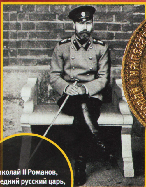
Николай II Романов, последний русский царь, правил в 1894—1917 гг.

Имперское денежное обращение прекратилось в 1917 г., когда были отчеканены последние кратные рубля из серебра и меди на монетном дворе в Петрограде: так стали называть Санкт-Петербург в 1914 г.