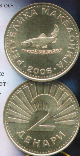
Аверс и реверс монеты 2 денара 2006 г.

Пятого мая 1993 г. македонская валюта была переоценена по курсу 1 новый денар (MKD) к 100 старым (MKN). В том же году появились банкноты 10, 20, 50, 100 и 500 денаров, а также монеты 50 дени, 1, 2 и 5 денаров. В 1996 г. выпустили третью серию банкнот, включающую 1000 и 5000 денаров. В 2008 г. были отчеканены монеты 10 и 50 денаров.