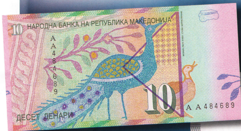
Аверс (справа) и реверс македонской банкноты 10 денаров. Выпускалась в 1996—2008 гг.