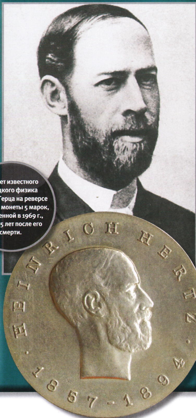
Портрет известного немецкого физика Генриха Герца на реверсе памятной монеты 5 марок, выпущенной в 1969 г., через 75 лет после его смерти.

Имя Генриха Герца связано с исследованиями электромагнитных волн. В его честь была названа единица измерения их частоты (герц).