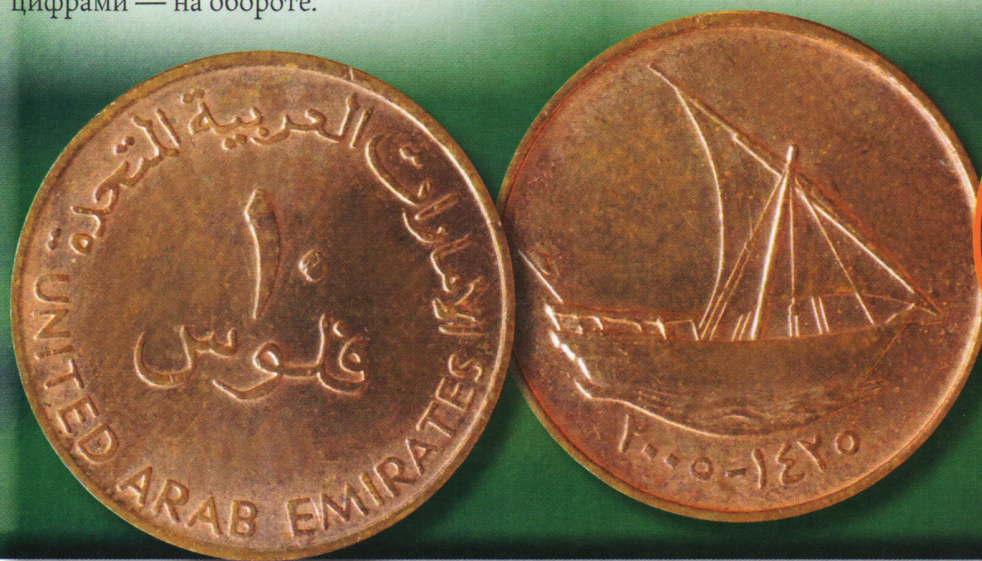
Редкая монета 10 филсов 2005 г. очень интересна для коллекционеров. На реверсе работы (как и у остальных монет ОАЭ) английского гравера Джеффри Колли изображен традиционный самбук, парусное судно.