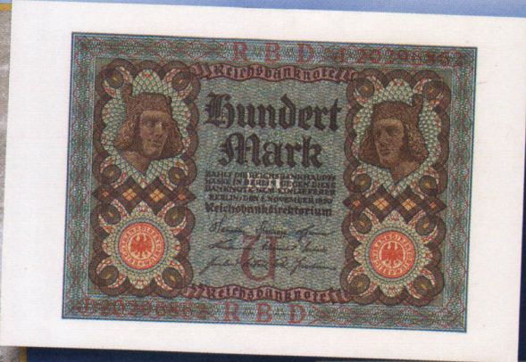
◀ 100 марок 1920 г. с «Витязем» из Бамбергского собора на лицевой стороне. Между двумя портретами можно разглядеть контур германского орла.

Статуя «Витязь» высотой 2 метра 33 сантиметра, помещенная на пилястре восточного хора в Бамбергском соборе, вырезана из камня в первой половине XIII в. По самой распространенной версии, это портрет Фридриха II Швабского.