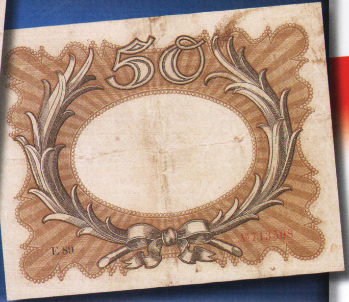
▲ Банкнота 50 марок, известная у англоговорящих коллекционеров как Egg note («банкнота-яйцо»): окошко с водяным знаком по форме напоминает яйцо. Напечатана 30 ноября 1918 г., через несколько дней после окончания Первой мировой войны.