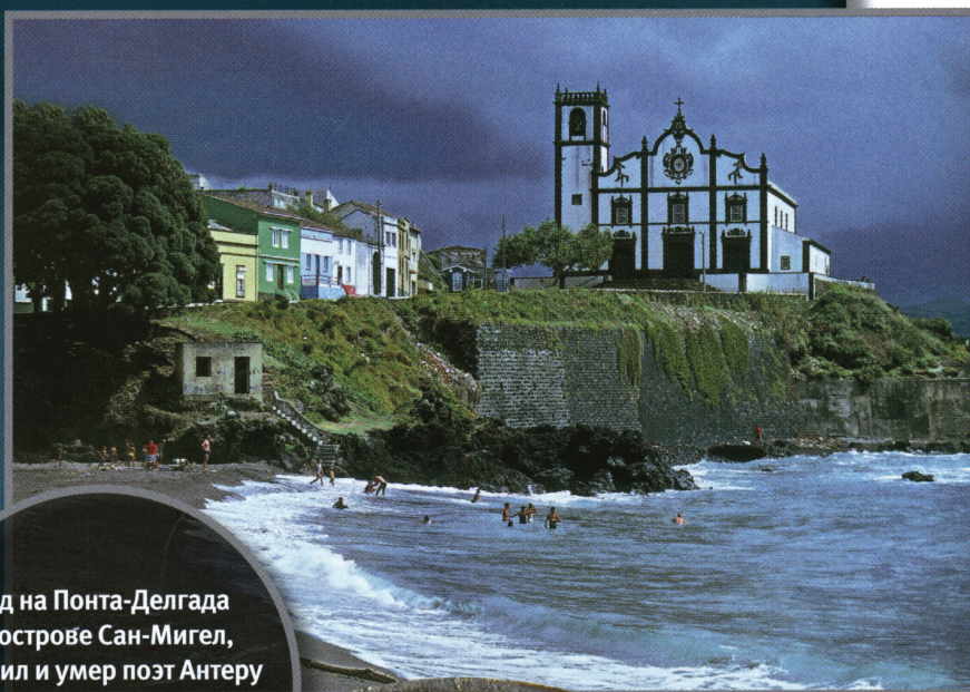
Вид на Понта-Делгада на острове Сан-Мигел, где жил и умер поэт Антеру де Кентал (1842—1891), которому посвящена монета на фотографии ниже.

В центре аверса изображена протянутая рука, безымянный палец и мизинец которой согнуты по направлению к ладони; видны часть запястья и широкий рукав. Фоном служит сияющее солнце. По всей видимости, это символ социалистической солидарности, в которую верил Кентал. Под рисунком внизу слева стоит государственный герб Португалии, принятый в 1911 г., но имеющий многовековую историю. Это щит с семью замками, внутри которого можно видеть еще один щит с пятью