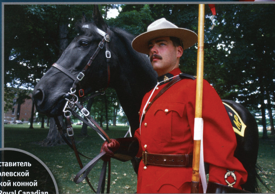
Представитель Королевской канадской конной полиции (Royal Canadian Mounted Police), основанной в 1873 г. Ей посвящена монета 25 центов (на фото ниже).

Первая версия называлась «small portrait» («маленький портрет»), к ней относилась большая часть монет; портрет королевы на ней был крупнее, а вдоль края шли 120 шариков. Вторая версия, более редкая, — «large portrait»