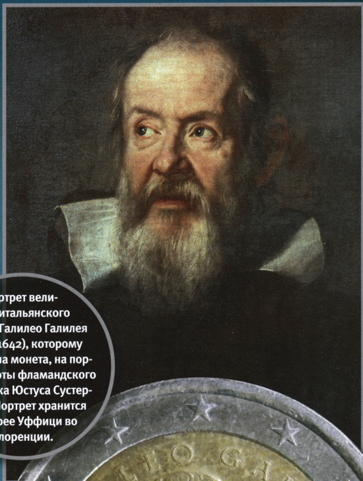
Портрет великого итальянского ученого Галилео Галилея (1564—1642), которому посвящена монета, на портрете работы фламандского художника Юстуса Сустерманса. Портрет хранится в галерее Уффици во Флоренции.

Аверс ничем не отличается от аверса других монет 2 евро; он общий для монет всех стран еврозоны. В левой части стоит очень крупная цифра номинала (2); справа от нее изображена карта Европы, на которой указано название валюты (евро), причем буква О заходит на внешнее кольцо. Две буквы L прямо под ней — инициалы бельгийского чеканщика Люка Люикса, автора дизайна. По правой части монеты проходят шесть прерывистых параллельных линий; по внешнему кольцу в промежутках между отрезками линий стоят двадцать звездочек (шесть вверху, шесть